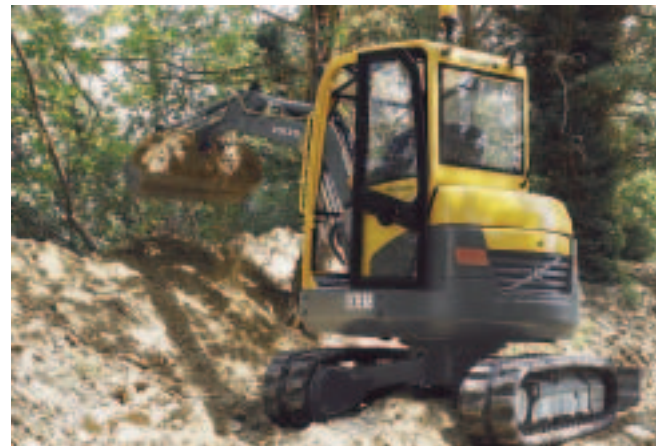
Hochleistung und Komfort: Kompaktbagger von Volvo

Im Garten- und Landschaftsbau sind flexible und multifunktionale Baumaschinen gefragt, Mobilität und Wendigkeit sind wichtig auf beengten Baustellen. Die neuen ECR-Kurzheckbagger von Volvo in der Gewichtsklasse 2,5 bis 8 Tonnen erfüllen diese Vorgaben. Nach dem Short-Radius-Konzept entwickelt, sind sie ideal für räumlich beengte Einsätze. Die aktuelle Serie umfasst die vier Modelle ECR28, ECR38, ECR58 und ECR88. Alle Modelle sind zwar außen kompakt, innen aber erstaunlich geräumig mit beachtlichem Sitz- und Bedienkomfort. Unbegrenzt vielfältige Einsätze bieten auch die Kompakt-Radlader von Volvo. Die neuen Lader L20B und L25B sind für Einsätze auf engstem Raum wie geschaffen. Mit geringer Bauhöhe können sie sich in Passagen mit nur 2,5 m lichter Durchfahrts Höhe bewegen. Trotz der kompakten