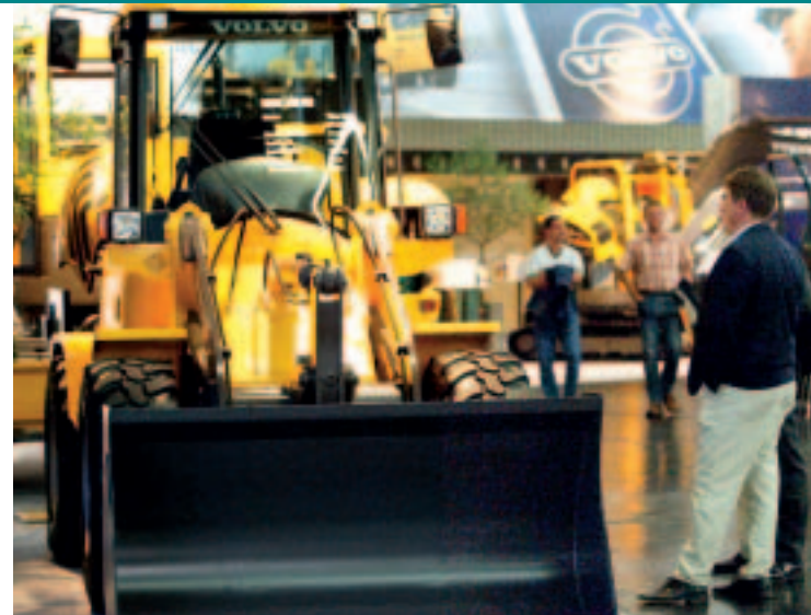
Der Trend bei Baumaschinen: Qualität, Komfort, Sicherheit, Umwelt- und Wartungsfreundlichkeit

Technik und Trends: Bei der Entwicklung neuer Maschinen ist die Umwelt-