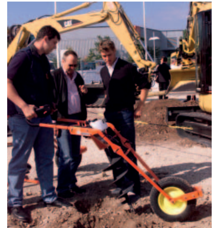
Ausprobieren heißt die Devise auf der GaLaBau.