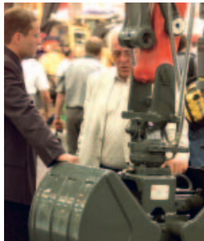
Service bedeutet auch umfassende Beratung – nicht nur auf der Messe GaLaBau