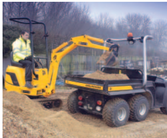
Große Grabtiefe: der JCB-Microbagger 8008

Beim Ausleger wurde durch Verwendung eines Rohrauslegers Gewicht eingespart. Alle Hydraulikschläuche werden sicher durch das Innere der Auslegerkonstruktion verlegt. Der 8008 hat mit 1.690 mm die größte Grabtiefe in der 800-kg-Klasse und besitzt eine Reichweite am Boden von 3.110 mm. Die kompakte Maschine kann auch mit JCB verschiedenen Anbaugeräten geliefert werden, unter anderem einem Planierschild. Dank intelligenter