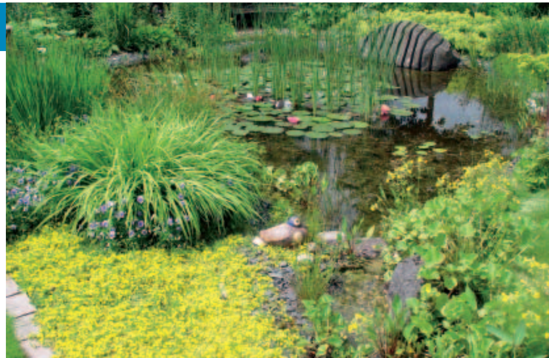
Grün sorgt für Lebensqualität – im privaten Garten, aber auch im öffentlichen Raum

Auf Bundesebene koordiniert der BGL übergreifende Belange der Landesverbände bei der Existenzsicherung der Betriebe und setzt sich für die Einhaltung von fairen Wettbewerbsbedingungen ein. So wird der BGL beispielsweise aktiv, wenn Konkurrenten aus dem Straßenbau-Handwerk den nicht bestehenden Handwerkschutz zum Nachteil konkurrierender GaLaBau-Betriebe auslegen. Der BGL leistet Unterstützung bei der Erschließung von neuen Arbeitsgebieten, beispielsweise in der Dachbegrünung und im Grünflächenmanagement. Letzteres gewinnt zunehmend an Bedeutung und die Landschaftsgärtner bringen sich dabei mehr und mehr als Komplettdienstleister erfolgreich ins Gespräch. Der BGL fungiert als ideeller Träger der „Internationalen Fachmesse Urbanes Grün und Freiräume – Planen – Bauen – Pflegen“, die alle zwei Jahre in Nürnberg zum Treffpunkt für die grüne Branche wird. Er präsentiert zur „GaLaBau“ ein umfassendes Rahmenprogramm: Zahlreiche Fachtagungen greifen Trends im Garten- und Landschaftsbau auf. Mit der Verleihung des Internationalen Trendpreises „Bauen