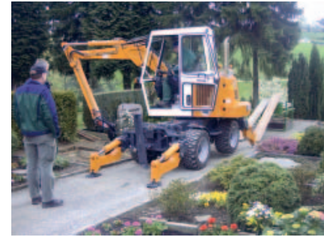
Mit neuer Kurzabstützung: Mobilbagger von Kiefer

Kiefer zeigt in Nürnberg den handgeführten, kompakten und wendigen Dreiradbagger Typ 2551 und größere Mobilbagger für breitere Wege mit hydrostatischem Fahrtrieb und vollhydraulischer Allradlenkung mit vier Lenkungsarten. Die beiden Mobilbagger Typ 4551 und Typ 6551 können jetzt in der Spur abstützen. Die einteilige Kurzabstützung Typ 900 wird anstelle des serienmäßi-