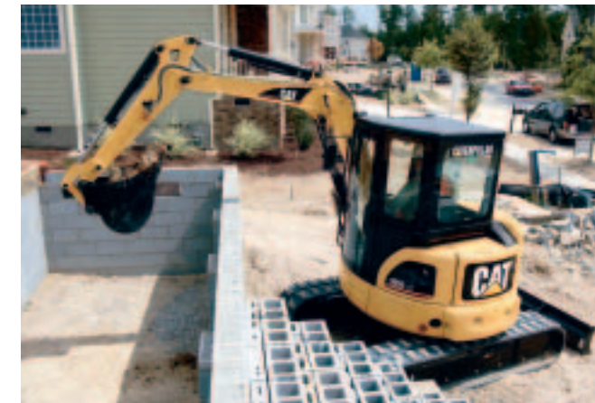
Kompakt und geräumig: Minibagger von Caterpillar

Newcomer von Caterpillar auf der GaLaBau sind die Kurzheck-Minibagger der C-Serie. Wer die Maschinen sieht, dem fällt auf, wie sanft sie sich bewegen und steuern lassen und welche Kraft sie trotz kompakter Form aufbringen. Die standardmäßige Load-Sensing-Hydraulik sorgt dafür, dass immer genau die Kraft zur Verfügung steht, die der Fahrer gerade für seine Arbeit benötigt. Das sichert zum einen hohe Grabkräfte und schnelle Taktzeiten, zum anderen wird unnötiger Kraftstoffverbrauch vermieden. Die Komfortkabine überzeugt mit fahrerfreundlicher Ausstattung und ergonomischen Bedienelementen. Ganz neu auf dem Markt ist auch die E-Serie der Cat-Baggerlader, die von Grund auf neu konstruiert wurde – ebenfalls mit hervorragender Hydraulik sowie komfortabler und geräumiger Kabine. Zu den Klassikern gehören die wendigen Cat-Kompaktlader, die vielseitigen kleinen Radlader und die Cat-Deltalader, die mit extrem niedrigem Bodendruck hervorra-