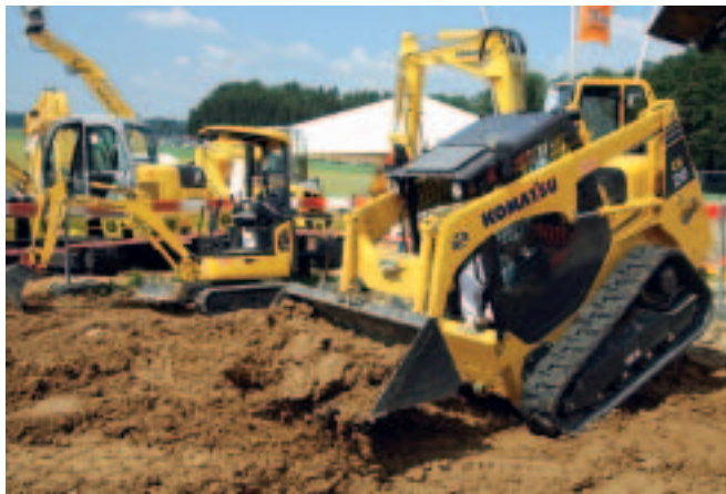
Elegante Performance: Kompaktlader von Komatsu