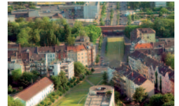
Tunnelbegrünung – hier an der südlichen Einfahrt zum Rheinufertunnel in Düsseldorf

Die Unterstützung bei Veranstaltungen (darunter Bundesgartenschauen und Internationale Gartenschauen), sowie die Pressearbeit und die Herausgabe von Publikationen (Verbandszeitschrift „Landschaft Bauen & Gestalten“, Fachbroschüren, Informations- und Werbeblätter) zählen zur Öffentlichkeitsarbeit des BGL für die Branche des Garten- und Landschaftsbaus. Die bundesweite Image- und PR-Kampagne der Landschaftsgärtner lenkt den Blick auf die Kompetenz und Leistungsfähigkeit der Experten für Garten und Landschaft. Mit ihren emotionalen und auffallenden Anzei-