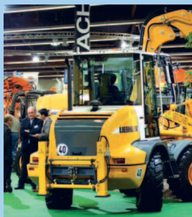
Die größten Messestände haben die Baumaschinen-Hersteller belegt

Messe für Bauschaffende im grünen Bereich mit einem wirklich aktuellen, vollständigen und lückenlosen Angebot genau für ihre Bedürfnisse.“ Auch den traditionellen Messetermin findet er genau richtig: „Entscheider haben im September schon einen guten Überblick, wie sie in ihrem Betrieb vorhandene Baumaschinen eingesetzt haben und welche sie brauchen.“