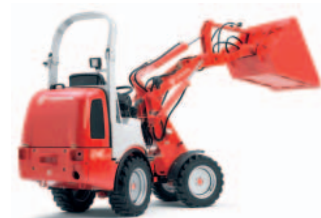
Wendiges Multitalent - Radlader von Weidemann.

Weidemann hat gemeinsam mit Kunden seine neuen Radlader der 12er CX-Serie konzipiert, um tägliche, vielfältige Arbeiten im GaLaBau so einfach wie möglich zu erledigen – etwa dem neuen 1250 CX35. Die kompakte Bauweise mit knapp 1 m Breite und einem Wenderadius von 80 cm innen ist ideal für den Einsatz auf engem, verwinkeltem Gelände. Wichtigste Neuerung ist die 100%ige Dif-